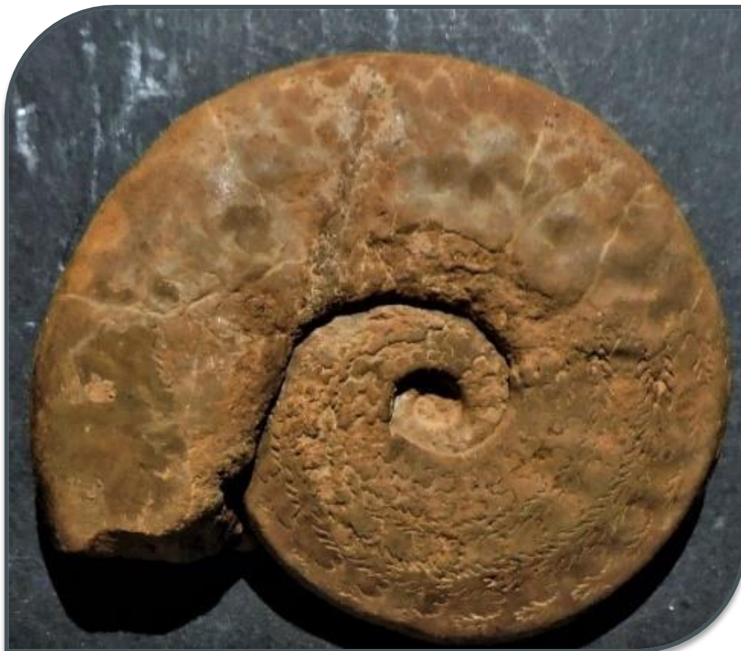
Fig. 2. Harpoceras (Harpoceratoides) domaticus .

Luogo di ostensione: Museo Geopaleontologico Naturalistico Antropico Ornitologico «Brancaleoni», Piobbico (PU) http://www.comune.piobbico.pu.it