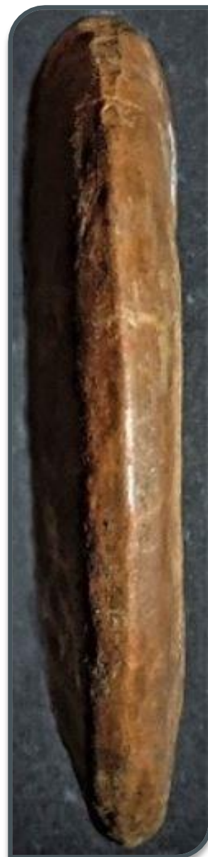
Fig. 3. Harpoceras (Harpoceratoides) domaticus .