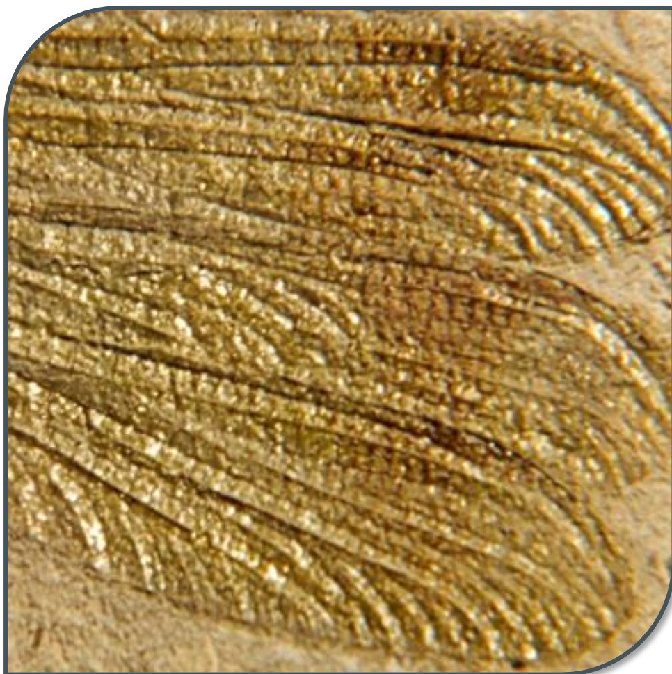
Fig. 2. Italolestes stroppai , olotipo; particolare ingrandito delle elitre. Notare che le elitre sono quattro; le prime due, superiori, sono parzialmente sovrapposte. È ben visibile la colorazione.

https://www.parcosanbartolo.it/luoghi/il-museo-paleontologico-l-sorbini