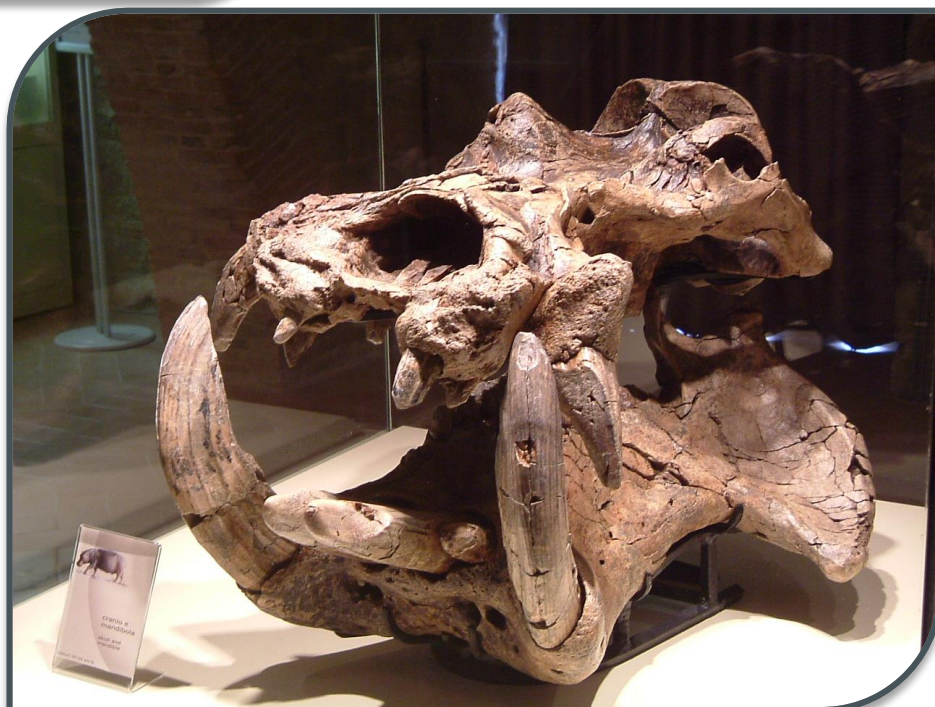
Fig. 3. Cranio di Hippopotamus antiquus .

https://sma.unicam.it/it/museo-delle-scienze