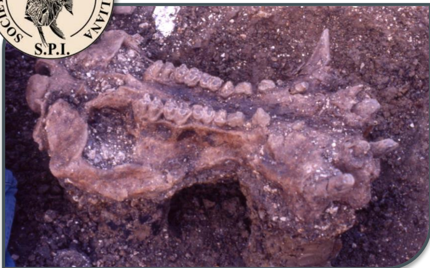
Fig. 2. Recupero del cranio.

Luogo di ostensione: Museo delle Scienze dell'Università di Camerino (MC).