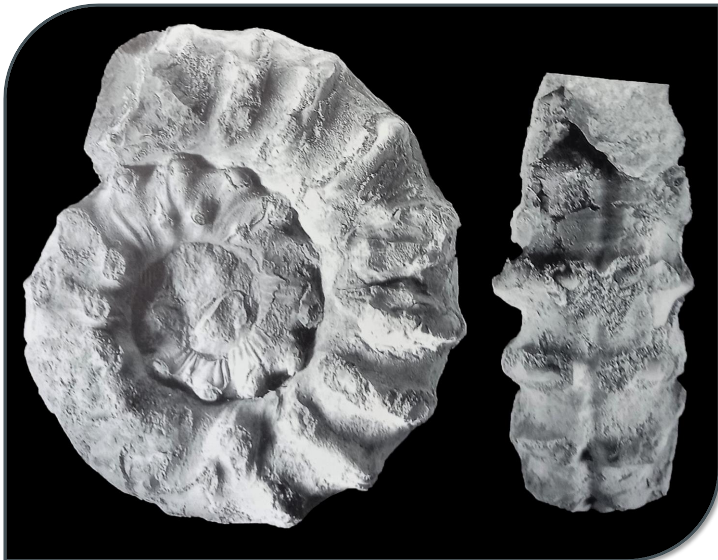
Fig. 2. Hybonoticerias (Hybopeltoceras) pavai .

http://www.comune.apecchio.ps.it/c041002/zf/index.php/musei-monumenti/index/dettaglio-museo/museo/2