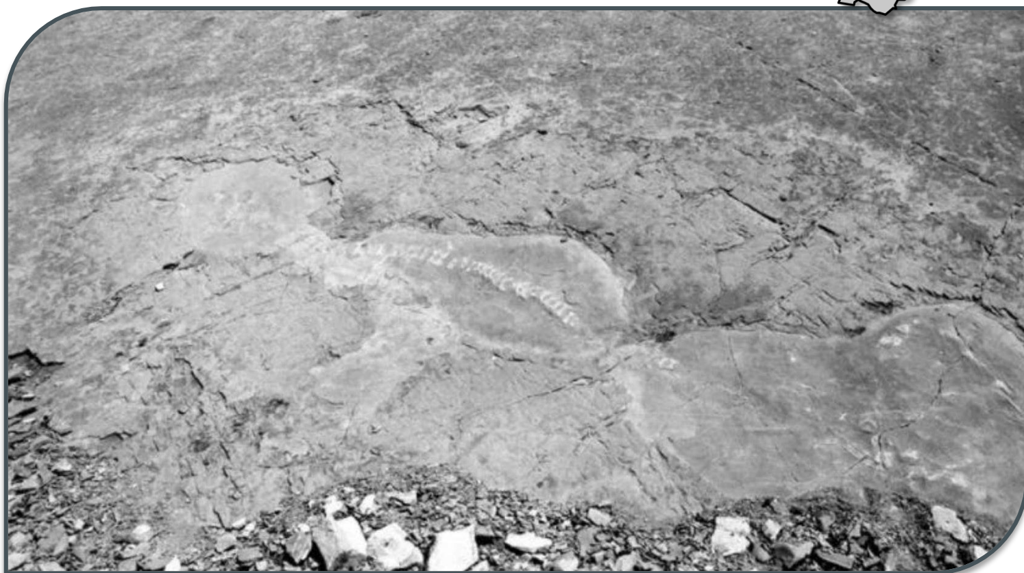
Fig. 1 Gengasaurus nicosiai in situ nel 1976.