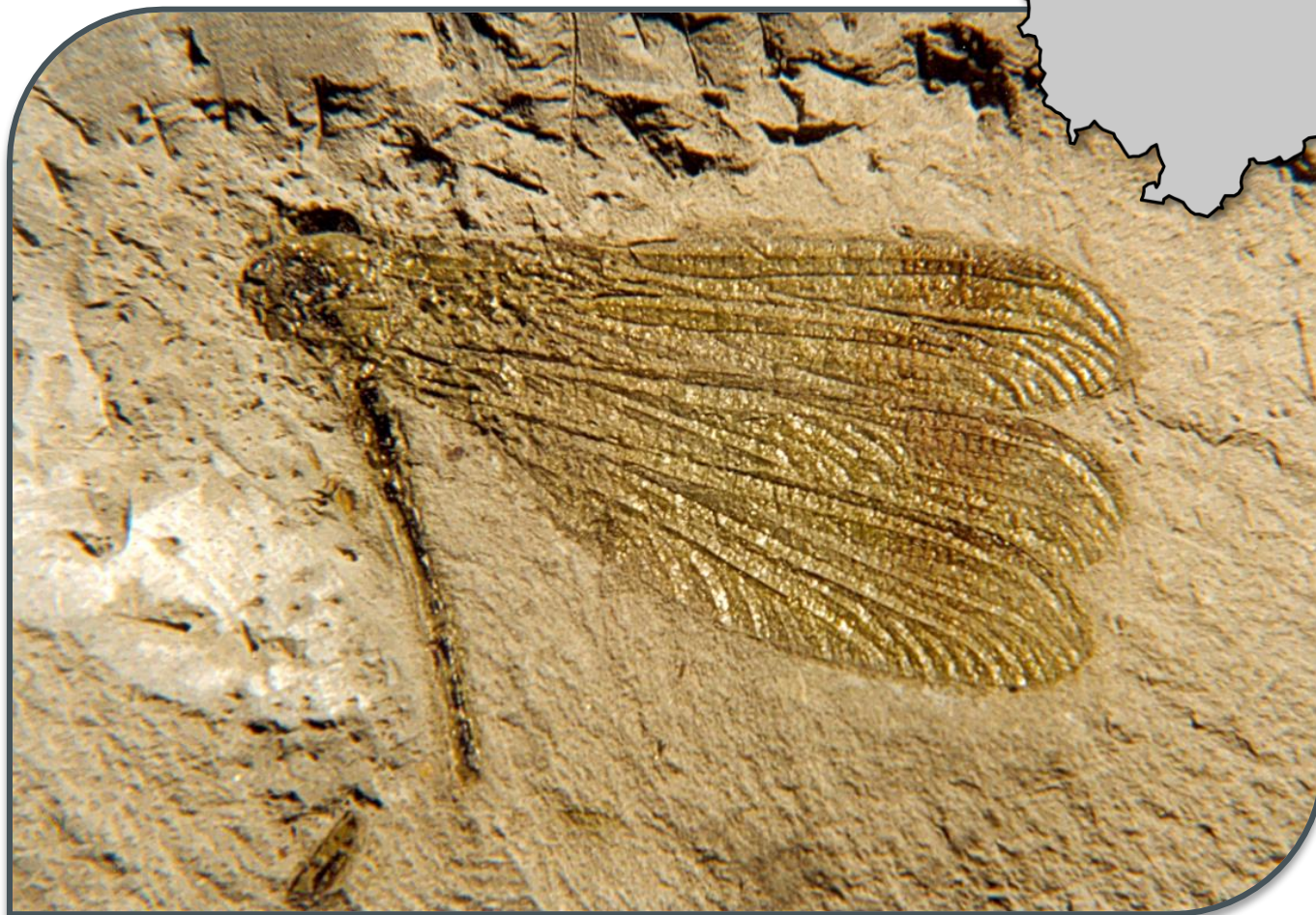
Fig. 1. Italolestes stroppai ; dimensioni: 4,2 x 2,6 cm.