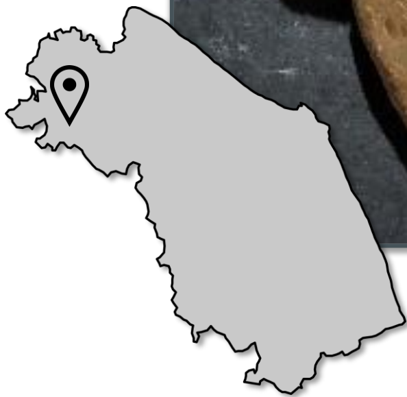
Fig. 1. Harpoceras (Harpoceratoides) domaticus ; diametro: 11,7 cm.